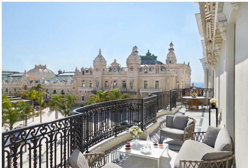
Suite à l'Hôtel de Paris Monte-Carlo

Les chambres de type classique offrent une ambiance plus colorée. Le mobilier est intemporel, rehaussé par quelques meubles de style Louis XVI pour apporter une touche de classicisme. Les tissus des chambres et salons dans les tons mordorés créent une ambiance chatoyante. Le miroir ancien, les détails de laiton sur les meubles minibars, les velours et coussins décoratifs en tissus précieux apportent un raffinement et un confort supplémentaires. Les matériaux luxueux, doux, lisses, créent un univers d'intérieur plein de lumière et de contrastes, délicatement pensé à l'image du client.