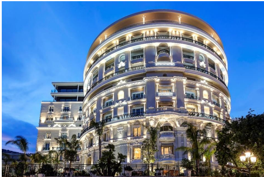
La Rotonde de l'Hôtel de Paris Monte-Carlo

... un palace intemporel, à l'architecture Belle époque remarquable et à l'esprit contemporain, sublimé par les architectes Richard Martinet et Gabriel Viora. Une marquise monumentale orne l'entrée, qui offre un ascenseur dont la grille décorative est issue d'un ancien ascenseur du Lobby. Ici, l'histoire commence par cette alliance singulière entre modernité et éléments historiques qui forgent l'âme des lieux.