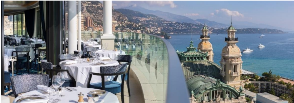
Restaurant Le Grill au 8 ème étage de l'Hôtel de Paris Monte-Carlo

Adresse des plus élégantes de la Principauté de Monaco, Le Grill est situé au huitième étage de l'Hôtel de Paris Monte-Carlo. Vue époustouflante sur la Méditerranée, décor d'inspiration marine, une cuisine de haut vol et à la demande de la Princesse Grace de Monaco, un toit panoramique, permettant à la légendaire Maria Callas de savourer ses dîners sous les étoiles.