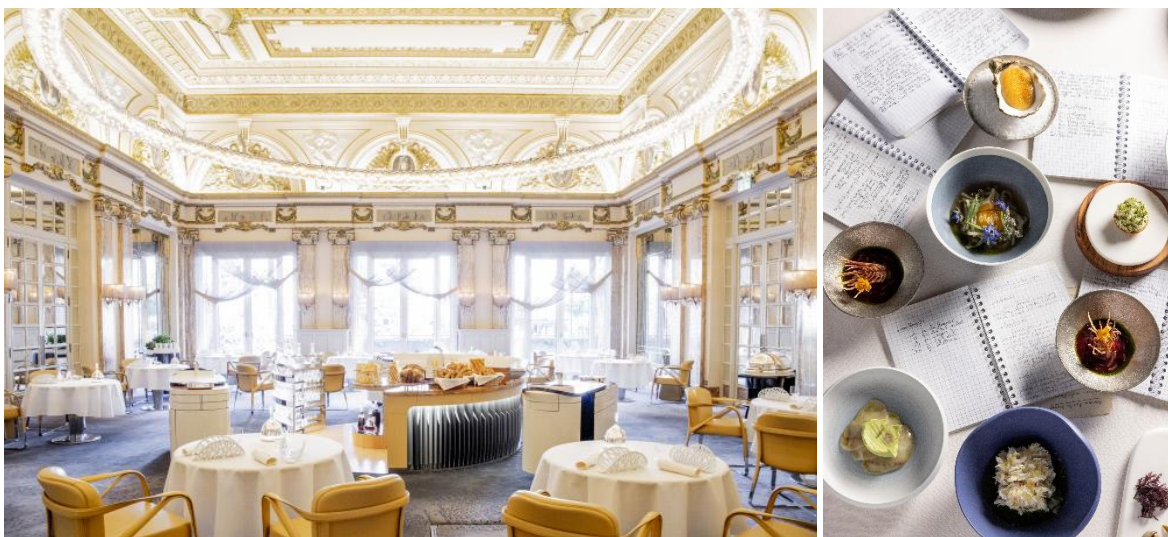
Le Louis XV – Alain Ducasse à l'Hôtel de Paris