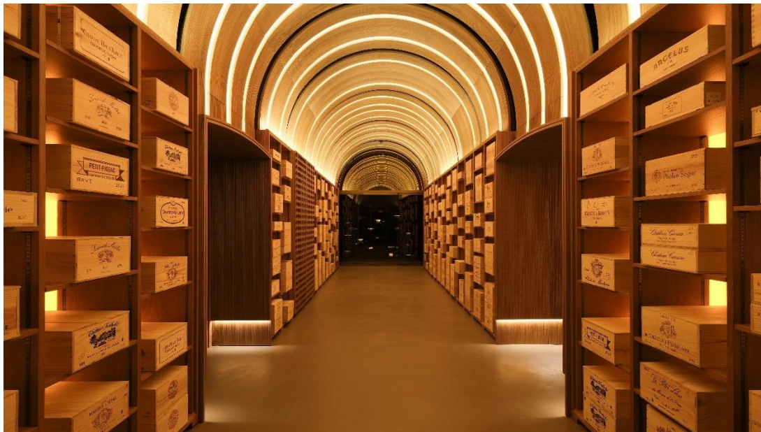
Caves de l'Hôtel de Paris Monte-Carlo

En 2025, les Caves opèrent une rénovation profonde en collaboration avec le Cabinet d'architecte Moinard Bétaille. A cette occasion, un club ultra-privé voit le jour : le Cercle des Caves de l'Hôtel de Paris Monte-Carlo, réservé aux plus grands amateurs de vins. Ce cercle exclusif offre à ses membres passionnés un accès privilégié aux plus grands crus et à des expériences œnologiques de haut vol : accords mets-vins exclusifs, rencontres avec des vignerons d'exception et accompagnement sur mesure par les sommeliers du Groupe Monte-Carlo Société des Bains de Mer.