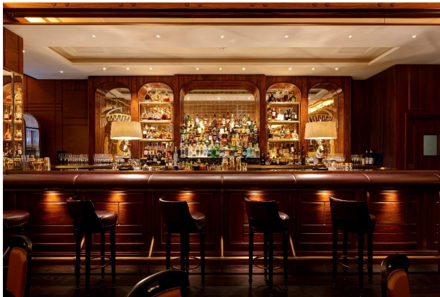
Le Bar Américain de l'Hôtel de Paris Monte-Carlo

Magnifié avec subtilité en 2018 par le cabinet d'architecture intérieure David Collins Studio, le Bar Américain marie avec élégance les ingrédients qui font son succès depuis 1928, et des éléments qui ont su réveiller sa personnalité. Les murs sont habillés de soie ambre et bourgogne, subtilement encadrés de bois de rose. Le nouveau mobilier rehaussé de cuirs aux tons rappelant les murs, crée un environnement immédiatement accueillant, où chaque place est valorisée. Une mosaïque de marbre au sol et des tapis profonds viennent donner au lieu son atmosphère feutrée et cosy, offrant un cadre glamour de jour comme de nuit, grâce à la douceur et à la chaleur des jeux de lumière.