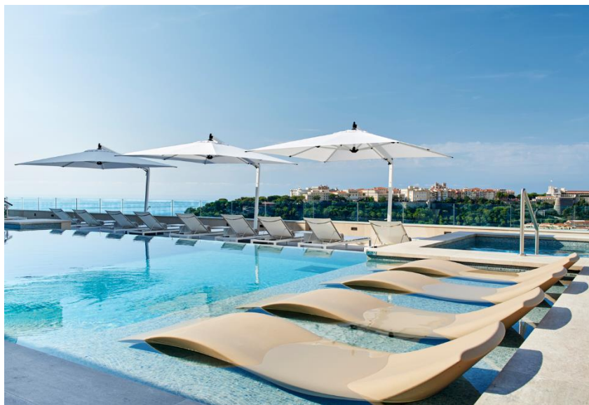
Wellness Sky Club