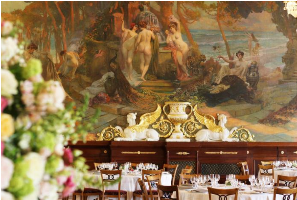
Salle Empire à l'Hôtel de Paris Monte-Carlo

La Salle Empire est ornée de ses mythiques peintures, dorures et de ses fresques légendaires. Toujours sollicitée pour les plus brillantes soirées de la Principauté, la Salle Empire est au service de dîners privés qui peuvent réunir jusqu'à 350 convives, mais aussi de concerts et shows pour un public trié sur le volet. C'est dans ce cadre unique en Europe que se célèbrent également les fêtes les plus spectaculaires, que ce soit un événement prestigieux, un anniversaire ou un grand mariage. Ce lieu historique est aussi le cadre de réunions internationales, de nombreux galas de bienfaisance, et de célébrations mémorables.