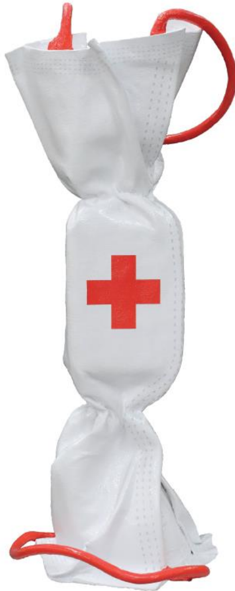
"Wrapping Candy Mask" 2021 Sculpture plexiglass 190 x 75 cm sur socle aluminium 75 x 75 cm