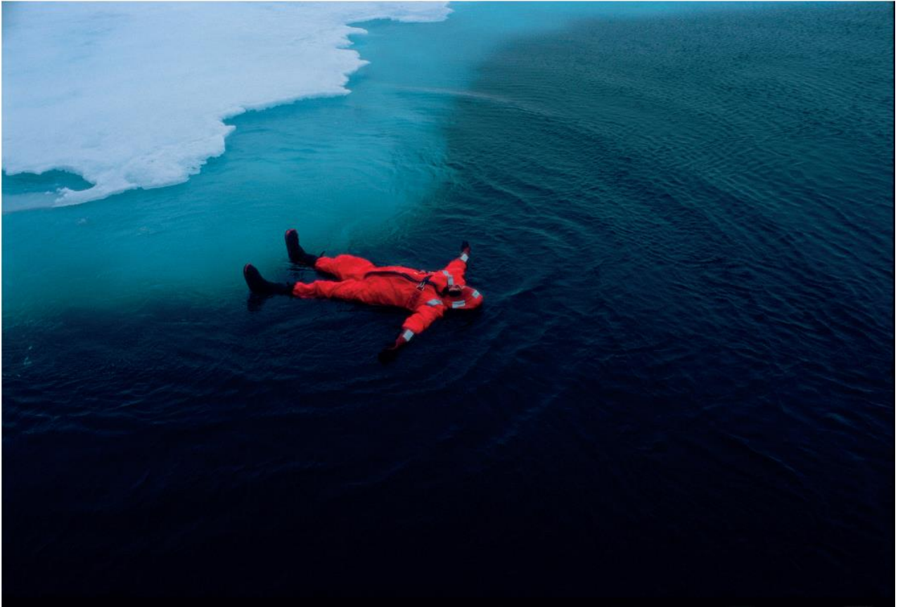
Prince Albert II of Monaco in a survival suit, Artic Ocean, Svalbard, 2005 – Dimensions : 65 x 44 cm