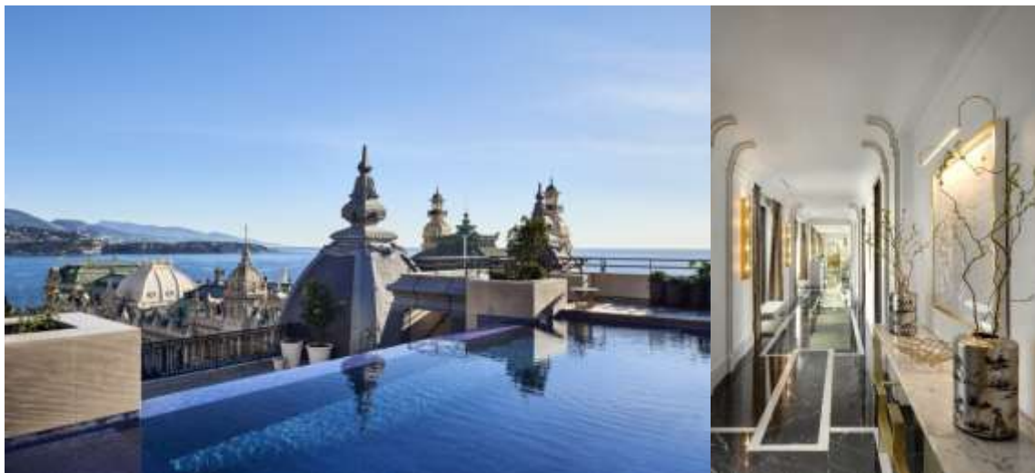
Suite Prince Rainier III

Depuis février 2019, cette suite exceptionnelle a été complétée par l'ouverture d'une seconde suite exclusive de 525m 2 , la Suite Prince Rainier III . La plus grande suite de l'Hôtel de Paris Monte-Carlo en termes d'espaces intérieurs avec 2 chambres, pouvant s'étendre sur 600 m 2 avec une 3ème chambre communicante, le tout ouvert sur la Place du Casino. Y est notamment proposés une douche-hammam et un sauna, un espace bar dans le salon principal, un espace bureau, ainsi qu'une superbe terrasse de 135 m 2 disposant d'une piscine à débordement avec nage à contre-courant.