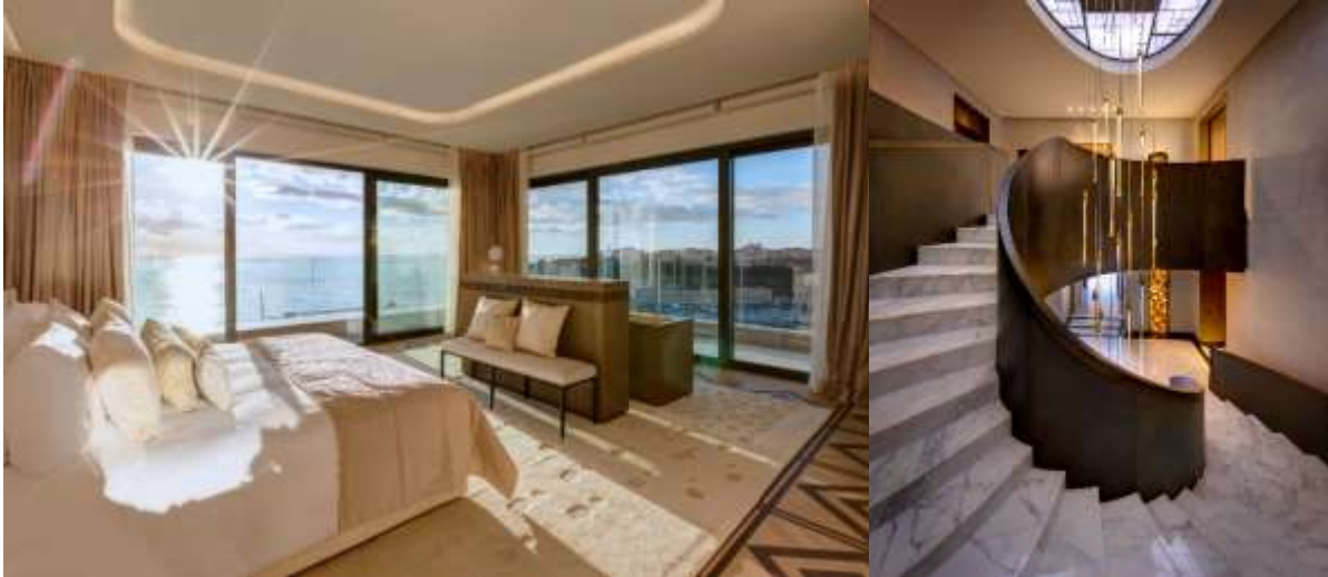
Suite Princesse Grace

La nouvelle Suite Princesse Grace est à ce jour l'écrin le plus exclusif et le plus exceptionnel de la Riviera. Inspirée par l'élégance intemporelle et le raffinement délicat de la Princesse Grace de Monaco, cette Suite de 910 m 2 sur 2 étages (7 ème et 8 ème étage), dont près de 440 m 2 d'espaces extérieurs, offre une expérience rare et intime pour un séjour qui ne ressemble à aucun autre.