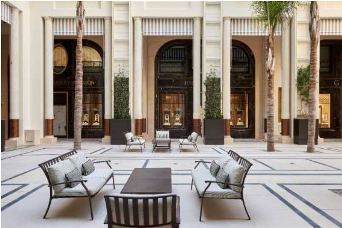
Le Patio de l'Hôtel de Paris Monte-Carlo

Un Patio intérieur arboré offre depuis décembre 2018 un écrin ultra-exclusif à de grandes Maisons de haute joaillerie telles que Graff, Harry Winston, Stardust Monte-Carlo ou Omega. Le Patio bénéficie d'un accès direct sur l'Avenue des Beaux-Arts, ouvrant sur le nouveau quartier One Monte-Carlo et sa promenade Shopping. Bordé d'un péristyle couvert, avec des sols en mosaïques reprenant les motifs de la coupole centrale du Lobby et des façades habillées de marbre massif Saint-Laurent, un marbre au noir profond et aux veines rouges et jaunes, l'espace central du Patio est pavé et orné de palmiers et d'arbres méditerranéens, créant ainsi une respiration végétale apaisante au cœur de l'Hôtel.