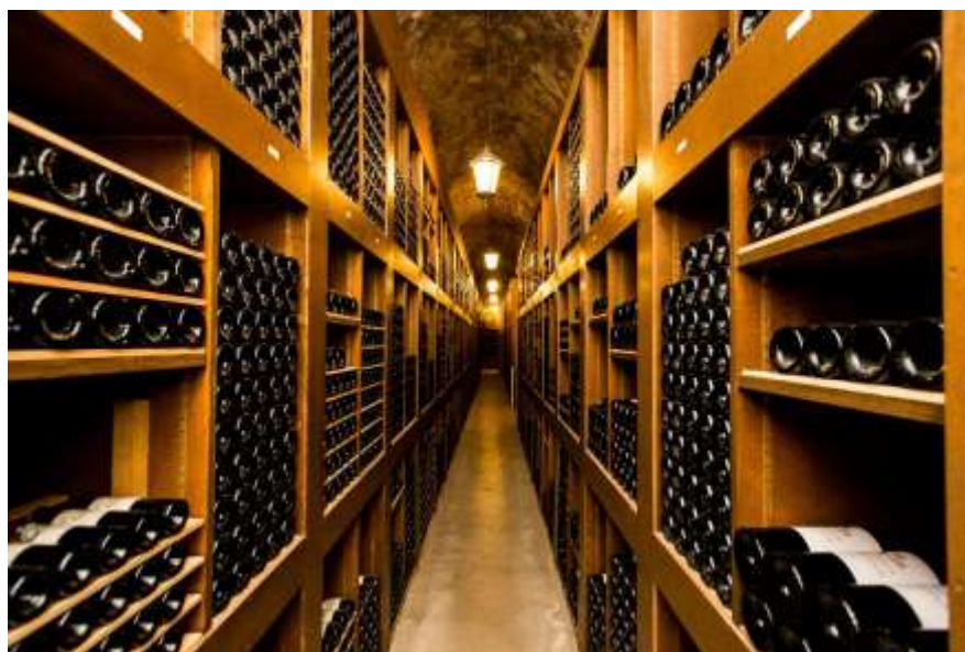
Caves de l'Hôtel de Paris Monte-Carlo

L'Hôtel de Paris Monte-Carlo doit également sa renommée à ses Caves, creusées derrière le palace en 1874 sur le modèle d'un chai bordelais. Ces Caves sont baptisées Cave Centrale, car elles fournissent tous les établissements du Resort de Monte-Carlo Société des Bains de Mer. Aujourd'hui, les Caves de l'Hôtel de Paris Monte-Carlo, fortes de leur surface totale de 1500m 2 et de leurs 350 000 bouteilles couchées sur plus de 1,5 kilomètre de casiers et 3700 références de vins sont une exception du genre. Il s'agit certainement de la plus importante cave d'hôtels et restaurants au monde. Vins rares et eaux-de-vie réputées se partagent cet univers particulier dans des conditions de conservation optimale. Les très anciens millésimes ne sont pas vendus mais entreposés dans la Réserve Marie-Blanc créée sur place en 1990. Les Caves de l'Hôtel de Paris Monte-Carlo reçoivent à dîner dans une salle de réception prévue à cet effet (jusqu'à 40 personnes). Cette opportunité merveilleuse, proposée par le palace sur demande, enchante par son approche insolite. En 1976, S.A.S. le Prince Rainier et S.A.S. la Princesse Grace y ont fêté leur vingtième anniversaire de mariage.