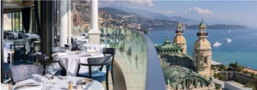
Restaurant Le Grill au 8 ème étage de l'Hôtel de Paris Monte-Carlo

Adresse des plus élégantes et animées de la Principauté de Monaco, Le Grill est situé au huitième étage de l'Hôtel de Paris Monte-Carlo. Vue époustouflante sur la Méditerranée et la Principauté, décor d'inspiration marine, cuisine de haut vol et toit s'effaçant pour offrir aux convives le plaisir d'un dîner sous les étoiles sont au rendez-vous de cette expérience magique.