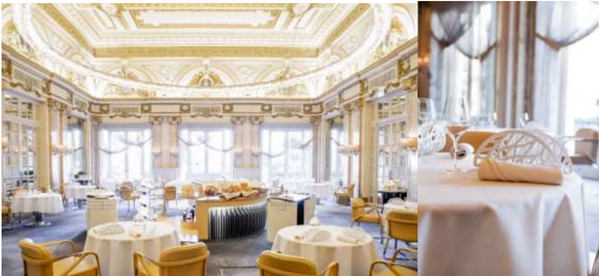
Le Louis XV – Alain Ducasse à l'Hôtel de Paris

Avec Alain Ducasse, Monte-Carlo Société des Bains de Mer a choisi l'excellence, ce qui a permis à l'Hôtel de Paris Monte-Carlo de devenir en 1990 le premier palace du monde à obtenir 3* au guide Michelin . Trois étoiles qui n'ont jamais cessé d'illuminer l'aura de cette table superbe. Situé au sein même de l'Hôtel de Paris Monte-Carlo, « Le Louis XV-Alain Ducasse à l'Hôtel de Paris » étonne et enchante par sa haute cuisine méditerranéenne. Alain Ducasse et son chef exécutif Dominique Lory, y développent une « cuisine de l'essentiel » : rendre un hommage permanent au produit, et s'appliquer à en révéler les parfums et les saveurs. Carte et menus composent un festin inoubliable qui se déroule comme un spectacle. La carte des vins est à l'image du lieu, comme à celle de l'Hôtel de Paris Monte-Carlo dont la cave est un authentique trésor de 350 000 bouteilles, illustration de ce que la France produit de meilleur dans ses vignobles les plus prestigieux. Le restaurant peut accueillir 50 convives, s'ouvre aux beaux jours sur une élégante terrasse de plain-pied donnant sur la Place du Casino et participe régulièrement, comme la Salle Empire, aux célébrations les plus grandioses de la planète culinaire.