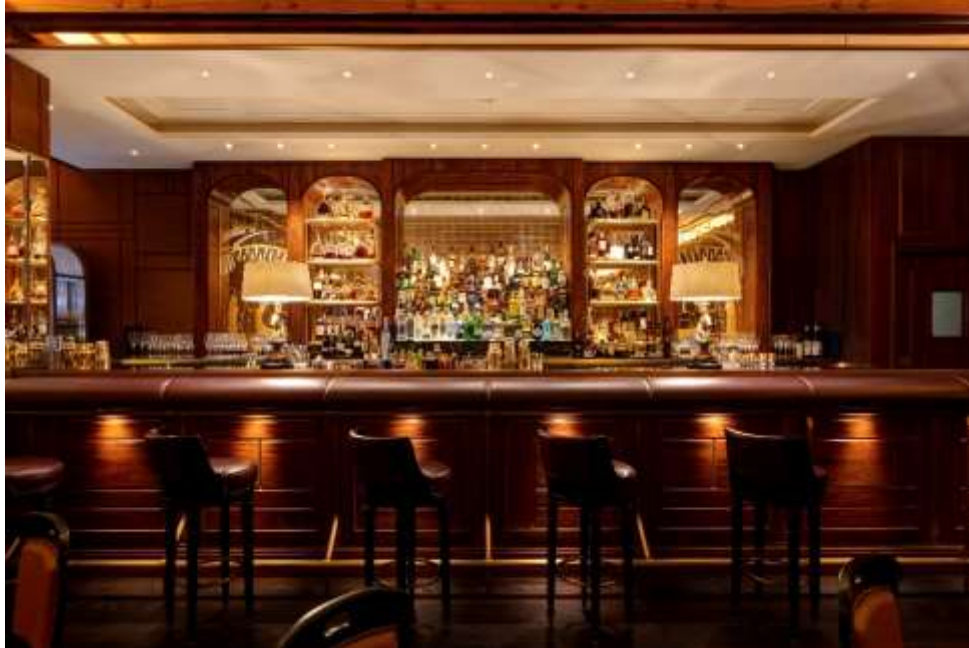
Le Bar Américain de l'Hôtel de Paris Monte-Carlo

Le mythique Bar Américain a dévoilé son nouveau visage pour la saison estivale 2018. Imaginé avec le cabinet d'architecture intérieure David Collins Studio, le nouveau Bar Américain marie avec élégance les ingrédients qui ont fait son succès et de nouveaux éléments qui réveillent sa personnalité. Les murs sont habillés de soie ambre et bourgogne, subtilement encadrés de bois de rose. Le nouveau mobilier rehaussé de cuirs aux tons rappelant les murs, crée un environnement immédiatement accueillant, où chaque place est valorisée. Une mosaïque de marbre au sol et des tapis profonds viennent donner au lieu son atmosphère feutrée et cosy, offrant un cadre glamour de jour comme de nuit, grâce à la douceur et à la chaleur des jeux de lumière.