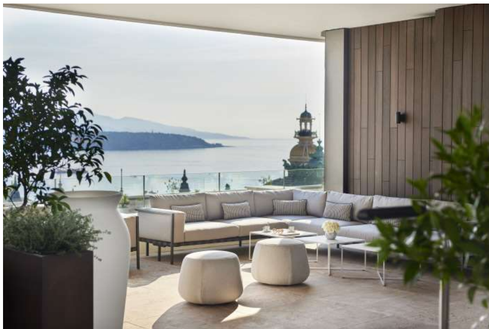
Wellness Sky Club

Parmi les nouveautés en termes de services : un espace Wellness sur le toit « Wellness Sky Club » réservé aux clients, ouvert depuis juillet est à découvrir avec 370 m 2 d'espaces intérieurs et 490 m 2 d'extérieurs, avec terrasse, piscine & transats, hammam, sauna, espace fitness et bar/espace lounge. Cette nouvelle offre vient en complément du Hairspa by Rossano Ferretti et de l'offre des Thermes Marins Monte-Carlo accessible directement depuis l'hôtel.