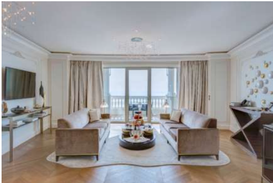
Diamond Suite à l'Hôtel de Paris Monte-Carlo

Les chambres de type classique offrent une ambiance plus colorée. Le mobilier est intemporel, rehaussé par quelques meubles de style Louis XVI pour apporter une touche de classicisme. Les tissus des chambres et salons dans les tons mordorés créent une ambiance chatoyante. Le miroir ancien, les détails de laiton sur les meubles minibars, les velours et coussins décoratifs en tissus précieux apportent un raffinement et un confort supplémentaires. Les matériaux luxueux, doux, lisses, créent un univers d'intérieur plein de lumière et de contrastes, délicatement pensé à l'image du client.