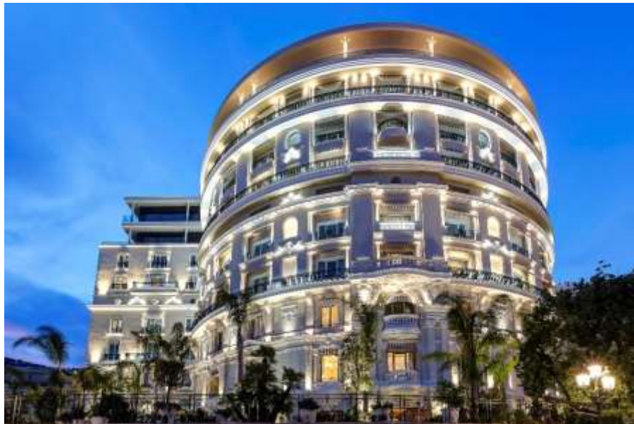
La Rotonde de l'Hôtel de Paris Monte-Carlo

Premier signe de la métamorphose de l'Hôtel de Paris Monte-Carlo : son architecture magnifiée, avec une façade qui retrouve son âme Belle Epoque de 1909 . L'esprit intemporel de l'Hôtel est conservé, tout en étant sublimé par un design contemporain grâce aux architectes Richard Martinet et Gabriel Viora qui se sont mis au service du bâtiment. Une marquise monumentale orne désormais l'entrée de l'hôtel, entrée offrant un nouvel ascenseur dont la grille décorative est issue d'un ancien ascenseur du Lobby : une belle manière d'apporter de la modernité tout en donnant une seconde envie à des éléments historiques qui forgent l'âme des lieux.