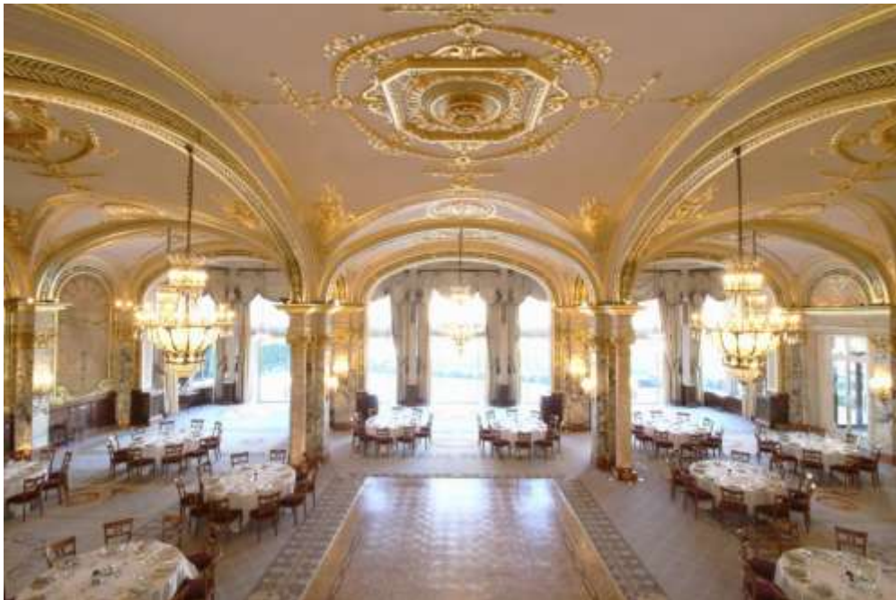
Salle Empire à l'Hôtel de Paris Monte-Carlo

La salle Empire a également fait peau neuve en vue des fêtes de fin d'année 2018, avec la restauration de ses peintures et dorures, et le nettoyage de ses fresques légendaires. La moquette a été remplacée tout en conservant son motif original. Les équipements techniques ont été modernisés et les espaces de back office réaménagés. Toujours sollicitée pour les plus brillantes soirées de la Principauté, la Salle Empire, classée, est au service de dîners privés qui peuvent réunir jusqu'à 350 convives, mais aussi de concerts et shows pour un public trié sur le volet. C'est dans ce cadre unique en Europe que se célèbrent également les fêtes les plus spectaculaires, que ce soit un événement prestigieux, un anniversaire ou un grand mariage. Ce lieu historique est aussi le cadre de réunions internationales, de nombreux galas de bienfaisance, et de célébrations mémorables.