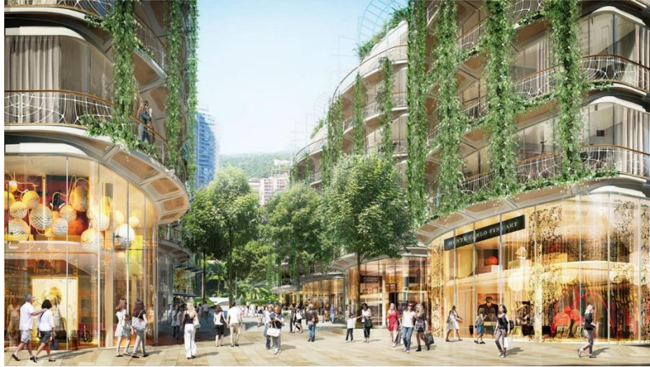
La nouvelle Promenade Princesse Charlène